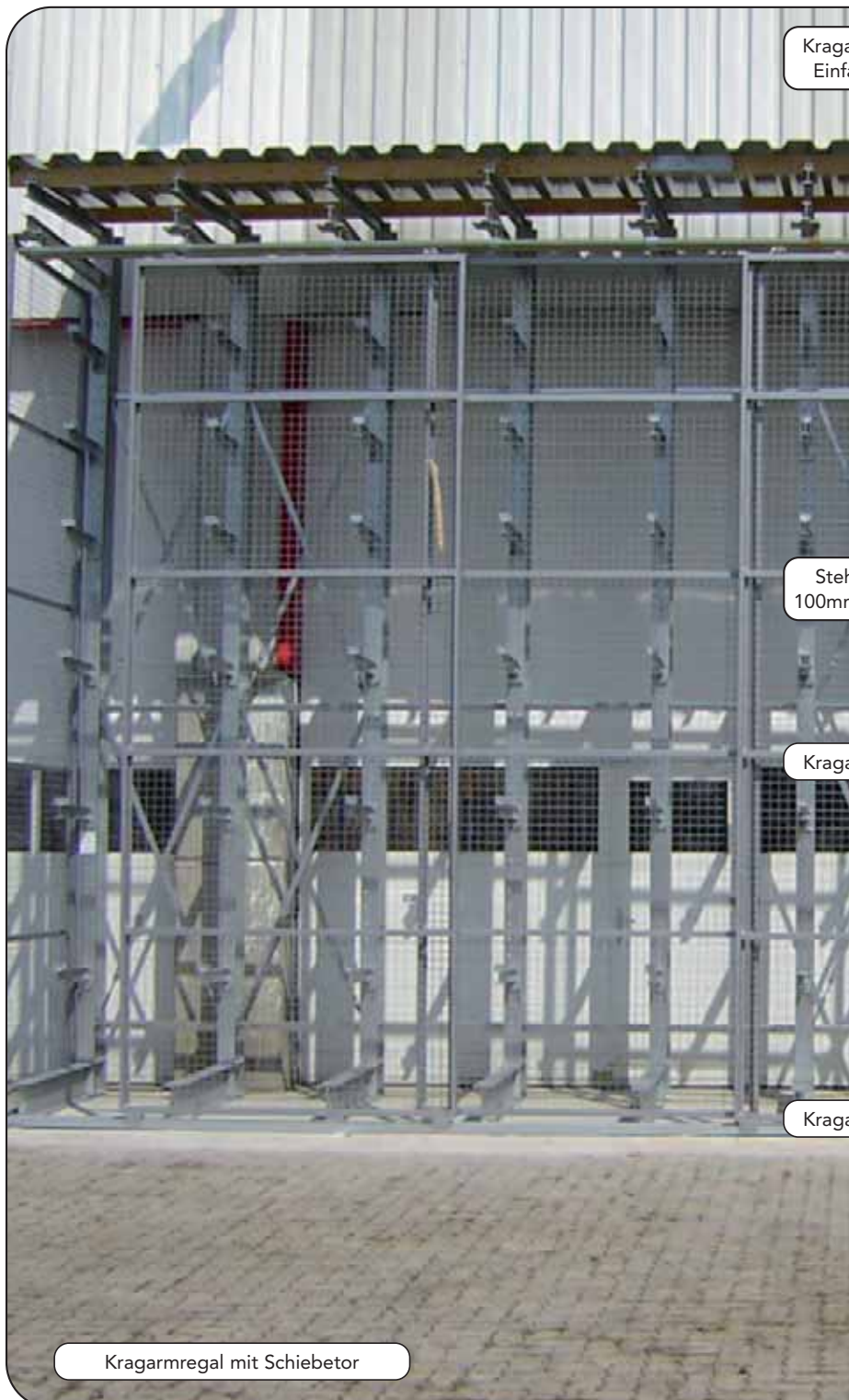
Kragarmregal mit Schiebetor