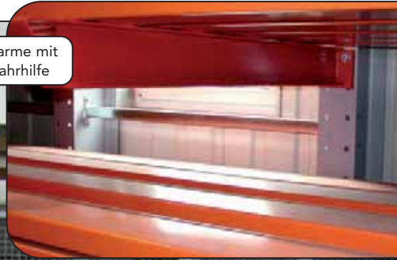
Kragarme mit Einfahrhilfe