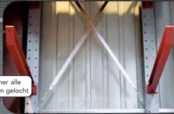
Steher alle 100mm gelocht