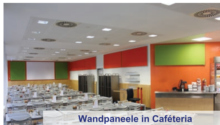
Wandpaneele in Cafeteria